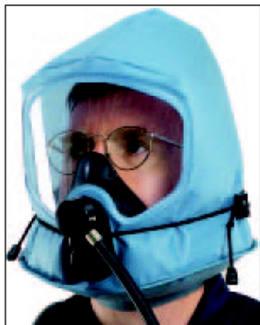
Capuz de ar com pressão positiva